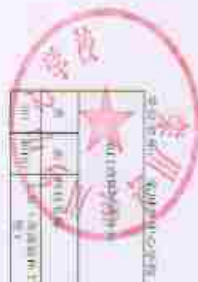
2020年一般公共预算基本支出情况表